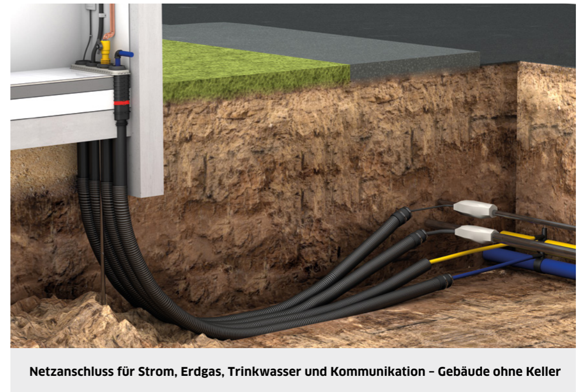
Netzanschluss für Strom, Erdgas, Trinkwasser und Kommunikation - Gebäude ohne Keller